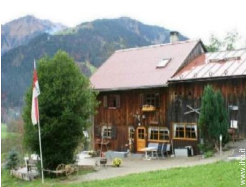
Chalet in Legno di Charme