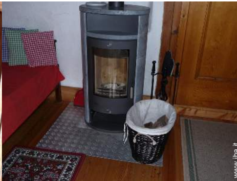
stufa a legna