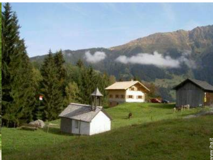
vista sulla montagna