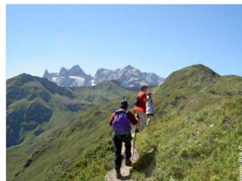
attività montane nelle vicinanze

Barbecue, barbecue a gas, tavolo da giardino, sedia(e) da giardino, ombrellone, 4 sedia sdraio, altalena, struttura rampicante per bambini, vasca per la sabbia