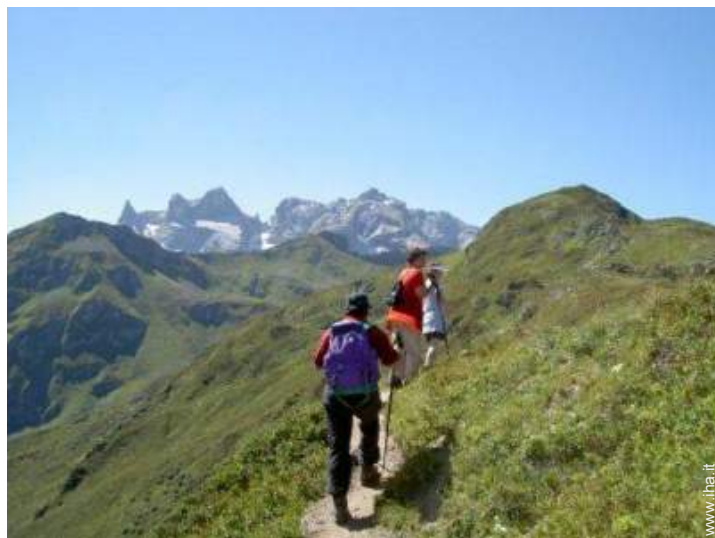
attività montane nelle vicinanze