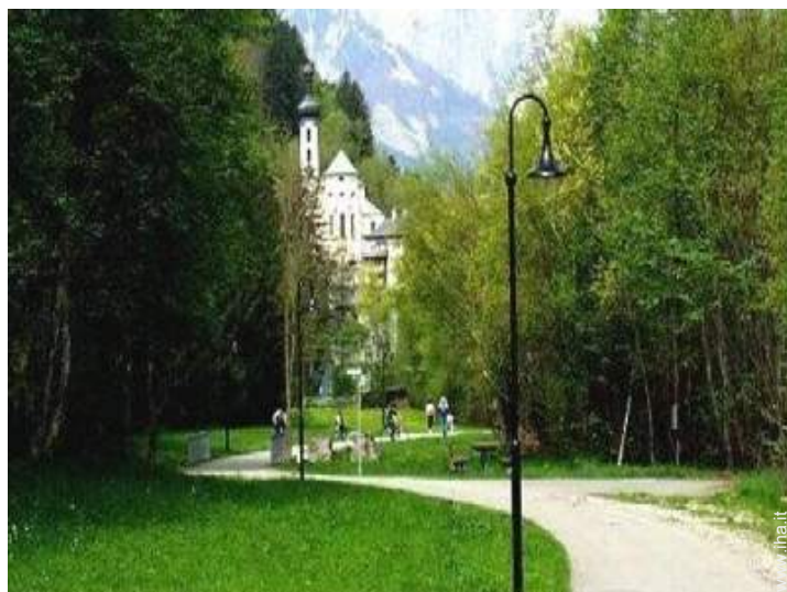
Attrazioni e relax