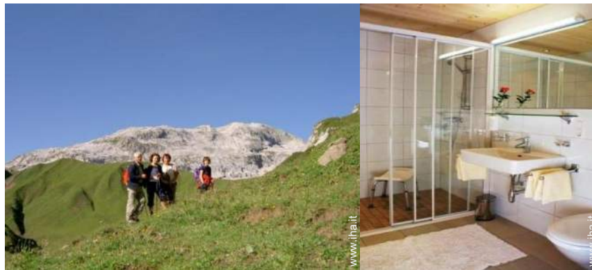
attività montane nelle vicinanze