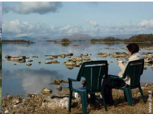
vista sul lago