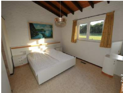
letti gemelli singoli