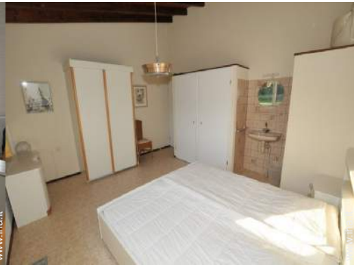
letti gemelli singoli