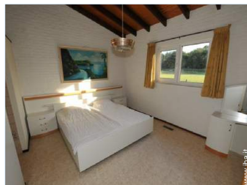
letti gemelli singoli