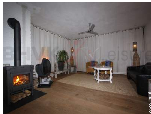
stufa a legna