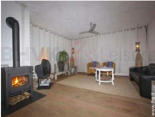
stufa a legna