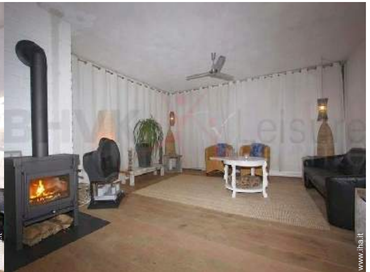
stufa a legna