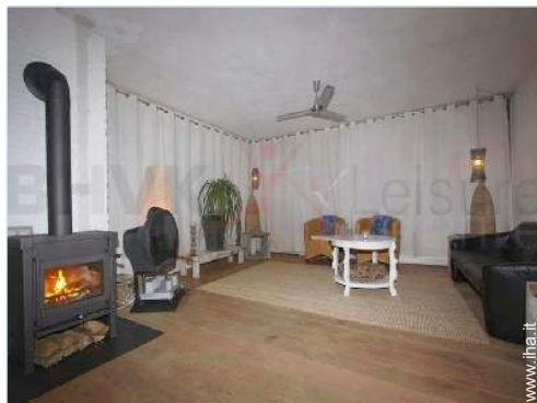
stufa a legna

Privilegi : Accesso diretto alla spiaggia, posto barca al porto, campo pratica, green